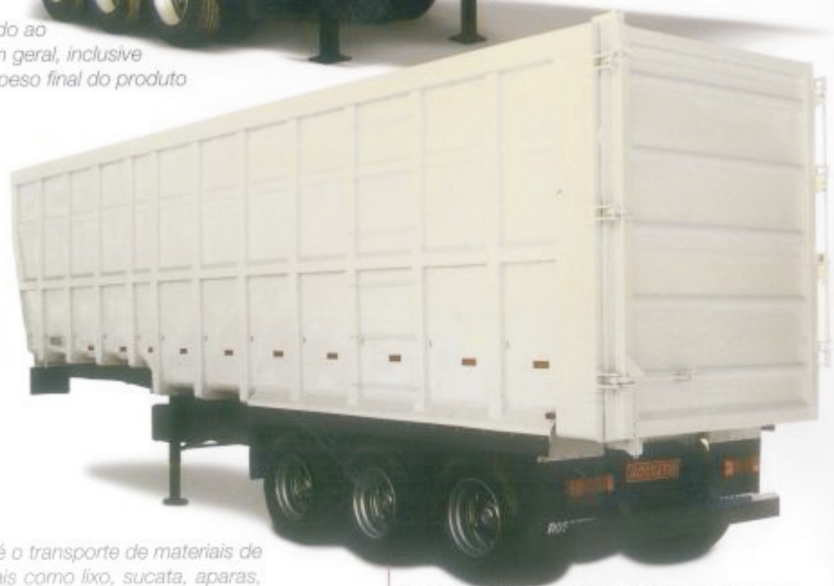
Semirreboque Rebaixado Grandes Volumes

Leve e robusto, adequado ao transporte de granéis em geral, inclusive mineração leve, onde o peso final do produto precisa ser controlado.