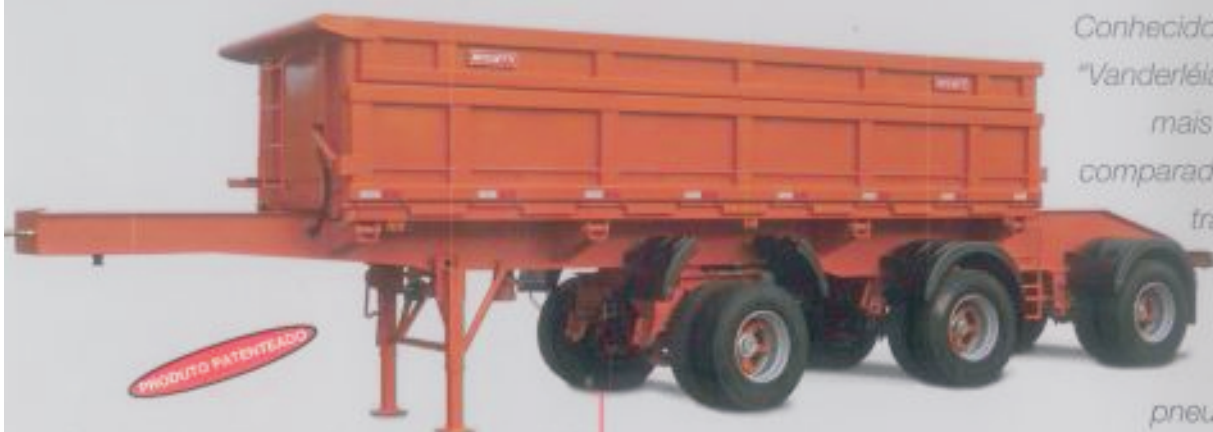
Semirreboque Basculamento Lateral 3D

Conhecido popularmente como "Vanderléia", permite até 30% a mais de "carga líquida" se comparado aos semirreboques tradicionais, tendo 53 t de PBT, em 3 eixos distanciados, com o primeiro direcional pneumático. Oferece total segurança durante o basculamento parado ou em movimento.